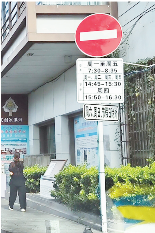
↑交通安全指示牌显示，相关时段限制车辆通行。

民警还提到，在整治期间，相关部门曾广泛征集属地社区、居民及游客的意见，获得了普遍支持。