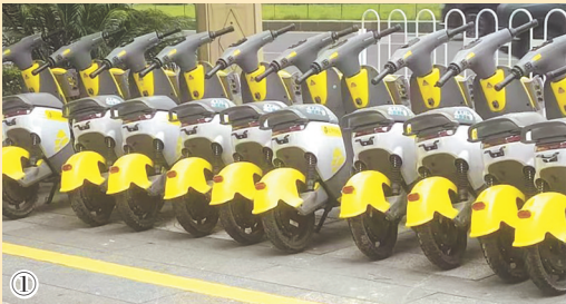
①②③没有牌照的共享单车。