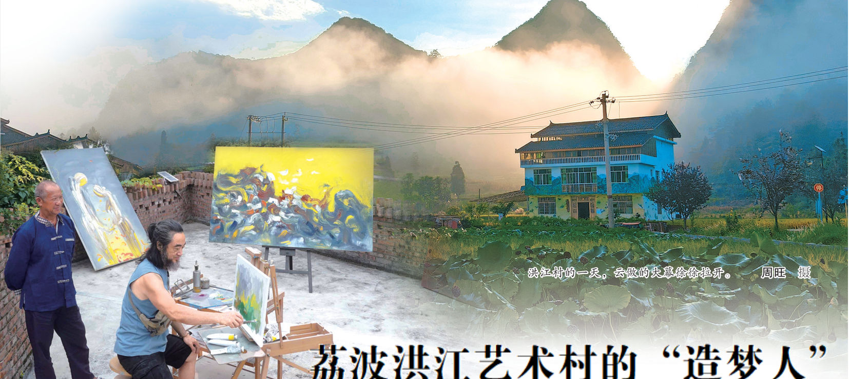
洪江村的一景。云雾缭绕，山峦叠嶂。

居住在民宿与老房子中间地带的，还是原村民。摆在村干部面前的现实课题是，如何让村子的发展，与当地村民建立实在联结，可持续的发展模式，能够惠及每家每户；如何留住为洪江发展立下头功的艺术家群体，让服务更快更好。韦永俊说：“我们会一直努力。”