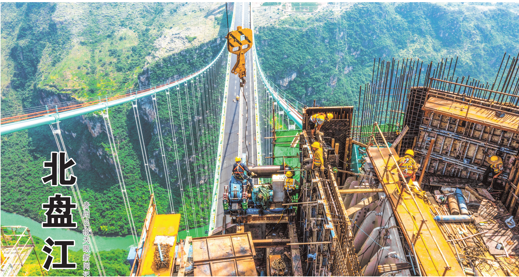
7月16日，工人在距江面800米高的花江峡谷大桥塔顶施工。

贫与富的变迁，彰显着桥梁集群的伟力。北盘江上的桥，连通的不仅是两岸，更是山里山外的市场与机遇；承载的不仅是车流，更是物流、信息流、资金流。曾经“种在山上，困在路途”的无奈，已被特色农产品飞出大山的喜悦取代；曾经望江兴叹的闭塞之地，正借助交通优势谋划产业新局。数以万计的桥梁构成贵州桥梁集群，成为驱动区域发展的强大引擎，深刻改写了地区的发展轨迹。 北盘江上的新高度，是空间的高度，更是发展的高度、梦想的高度。由3.2万余座桥梁托举起的“高速平原”，重塑了贵州的经济地理，也昭示着只要秉承“逢山开路、遇水架桥”的奋斗精神，天堑终成通途，山川皆为坦途。