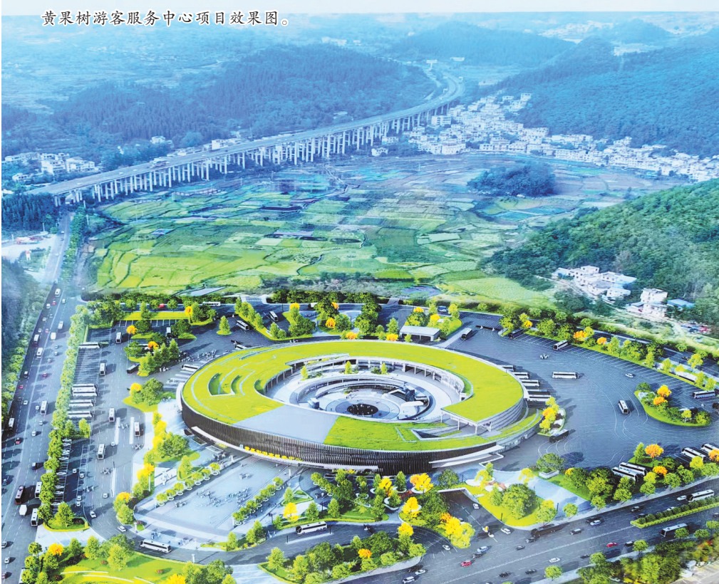
黄果树游客服务中心项目效果图。