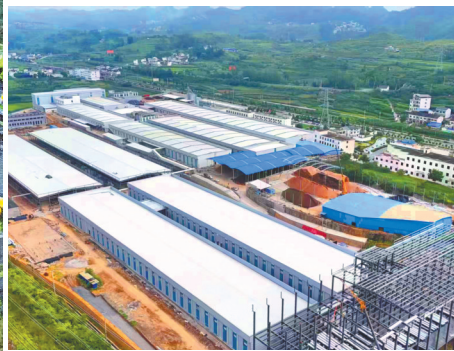
宏臻菌业二期项目建设现场。

是绝佳观景台，更通过立体绿化为建筑披上一层“隔热外衣”，让生态理念渗透到每个细节。