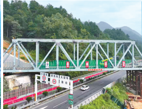
瓮马铁路6标上跨G75兰海高速中桥顺利完成拖拉。

据该项目负责人介绍，当前正推进基础工程建设，预计年底前完成基础施工及办公楼基础建设，2026年10月正式投产，预计年产值超40亿元、税收超3亿元，可带动200余人就业。