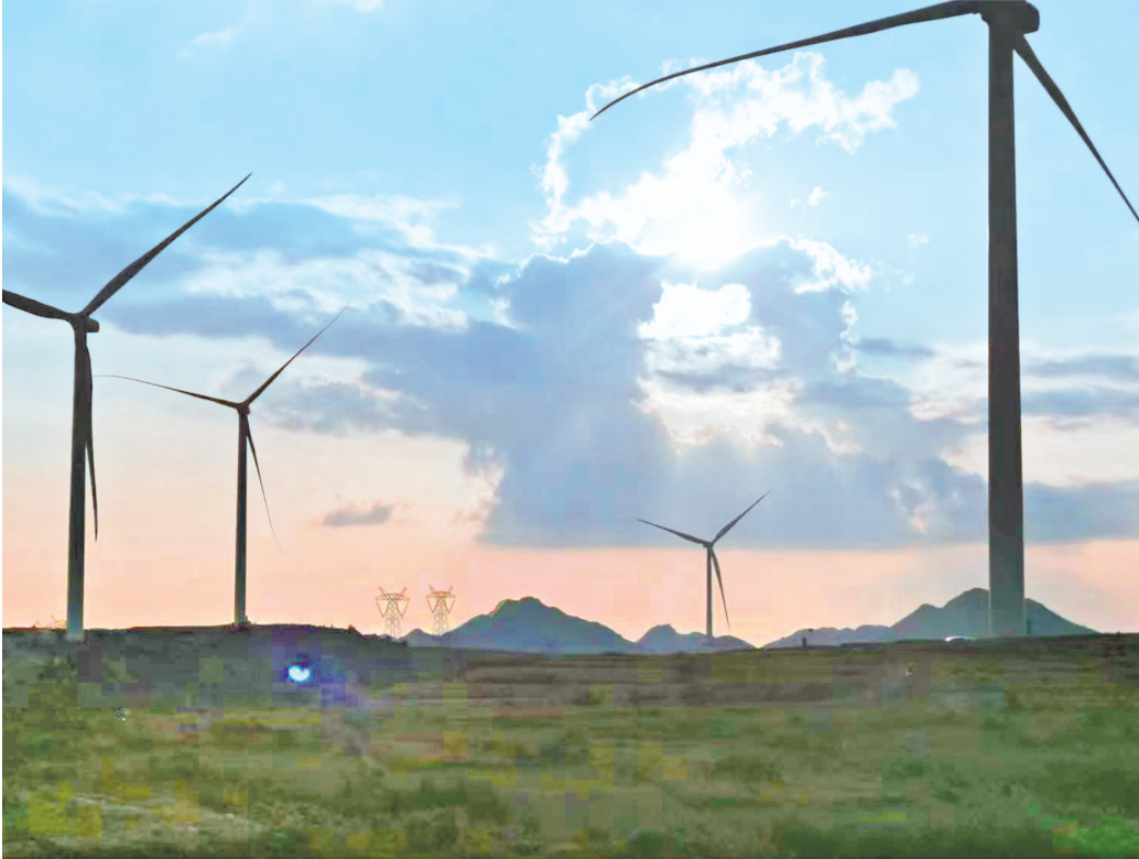
兴业银行贵阳分行贷款支持的风电项目。

面向“十五五”，朝气蓬勃的兴业人正沿着践行金融工作政治性、人民性的方向奋勇前进，士气如虹。