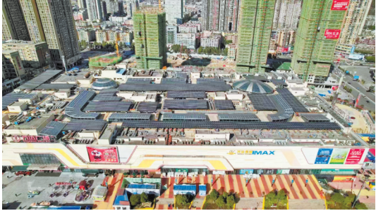
兴业银行贵阳分行贷款支持六盘水钟山万达广场分布式光伏项目建设。