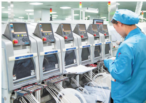
贵州翰瑞电子有限公司新设备“上岗”。

晨光初露，联积电子（贵州）有限公司万级无尘车间内，新建的两条全自动EPD模组生产线高速运转。薄如蝉翼的电子纸基材在精密辊轴间穿梭，纳米级电子墨水在基板上精准附着。