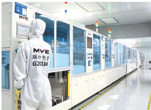
联积电子（贵州）有限公司新设备启用。（企业供图）