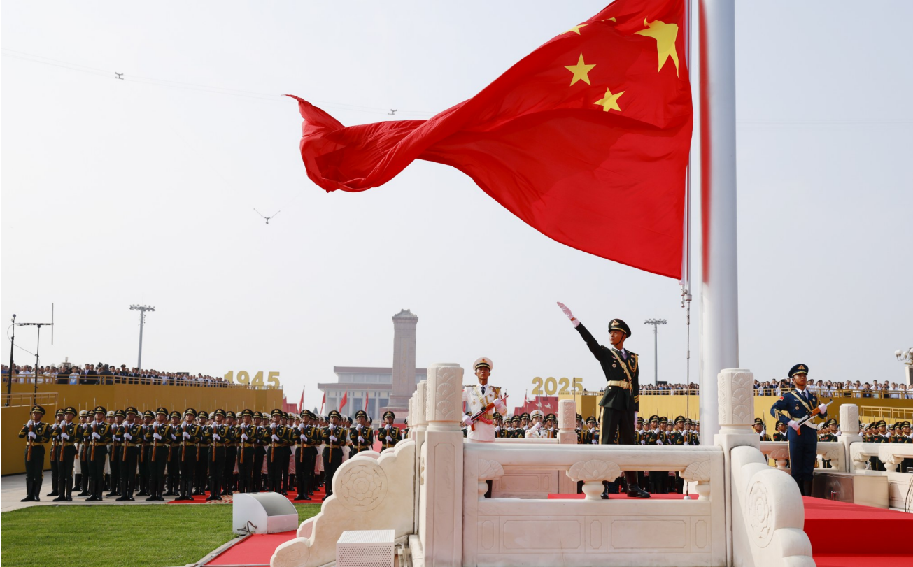
2025年9月3日，纪念中国人民抗日战争暨世界反法西斯战争胜利80周年大会在北京隆重举行。这是天安门广场举行隆重的升国旗仪式。

当胜利的曙光已然在望，是中国参与建立了战后国际新秩序，为巩固战争胜利成果注入了东方智慧。