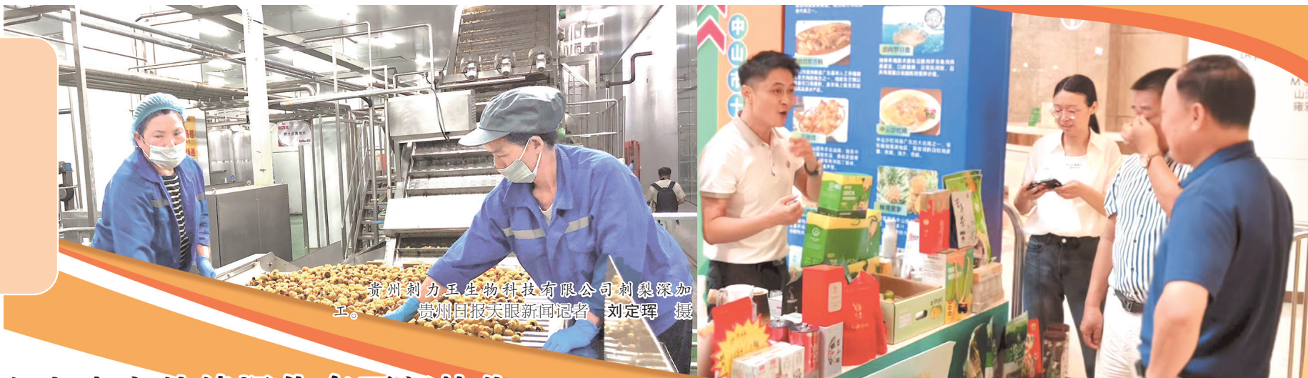
贵州刺梨王生物科技有限公司刺梨深加工。