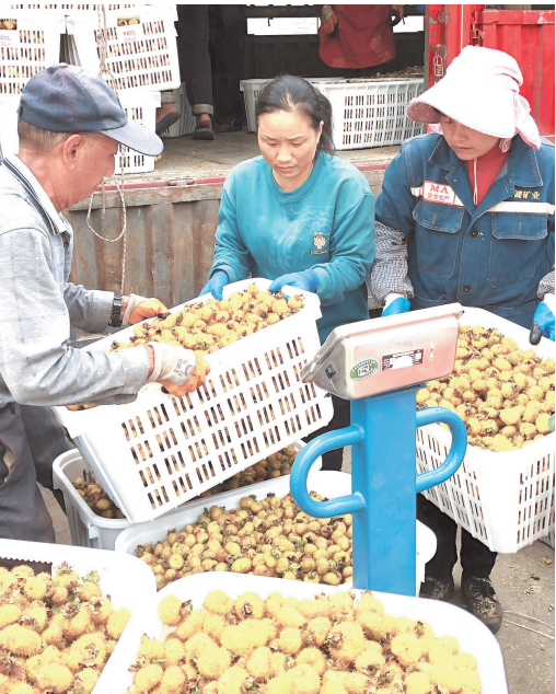
盘州市刺梨鲜果收购现场。