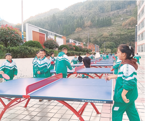
中山市体育彩票管理中心向六盘水市第八中学捐赠乒乓球桌。