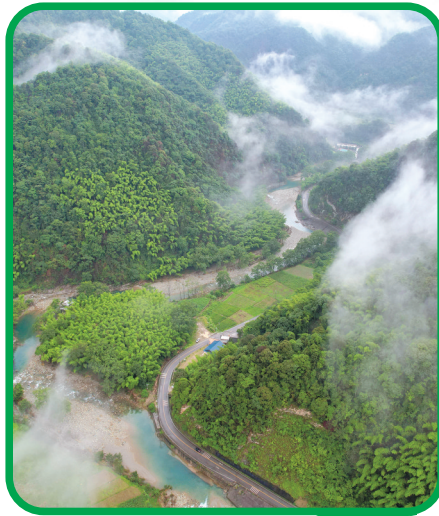
江口县太平镇凯文村生态美景。

从乌蒙山区的菌菇采摘到北盘江畔的花椒飘香，从梵净山下的活立木交易到贵安新区的亲水经济，贵州正通过多元化路径将生态优势转化为发展优势，让群众共享生态红利，在青山绿水间绘就绿色低碳高质量发展新画卷。