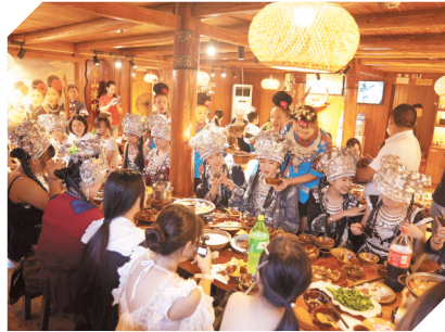
游客在阿浓苗家用餐。贵州日报天眼新闻记者 钱仕豪 摄