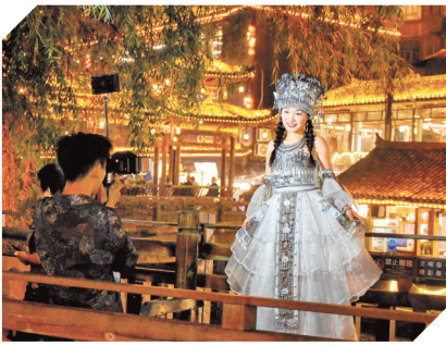
游客在旅拍。