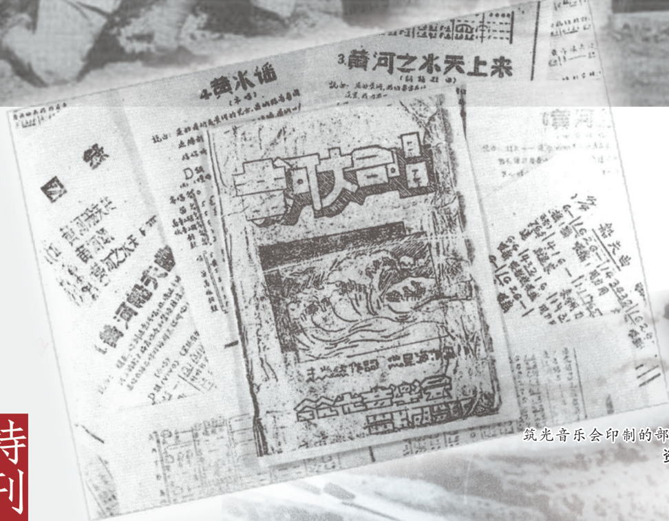
筑光音乐会印制的部分歌篇。