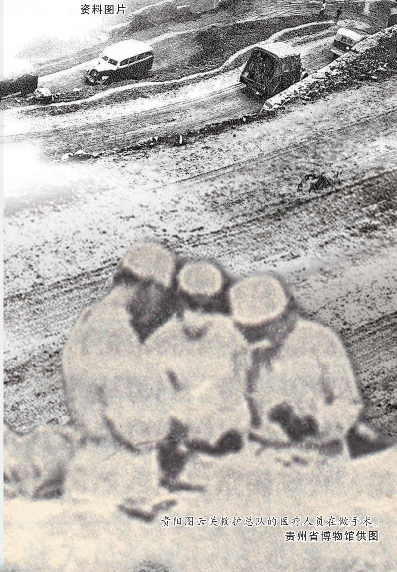
贵阳图云关救护总队的医疗人员在做手术。