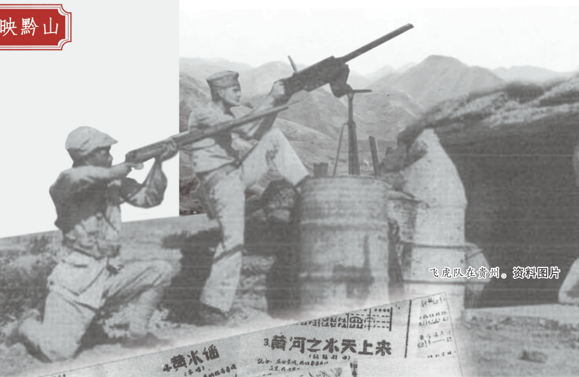
飞虎队在贵州。资料图片

中华民族的韧性和文脉在贵州得以延续，缘于在战火中甘将热血沃中华的贵州人，且看抗战大后方的贵州担当。