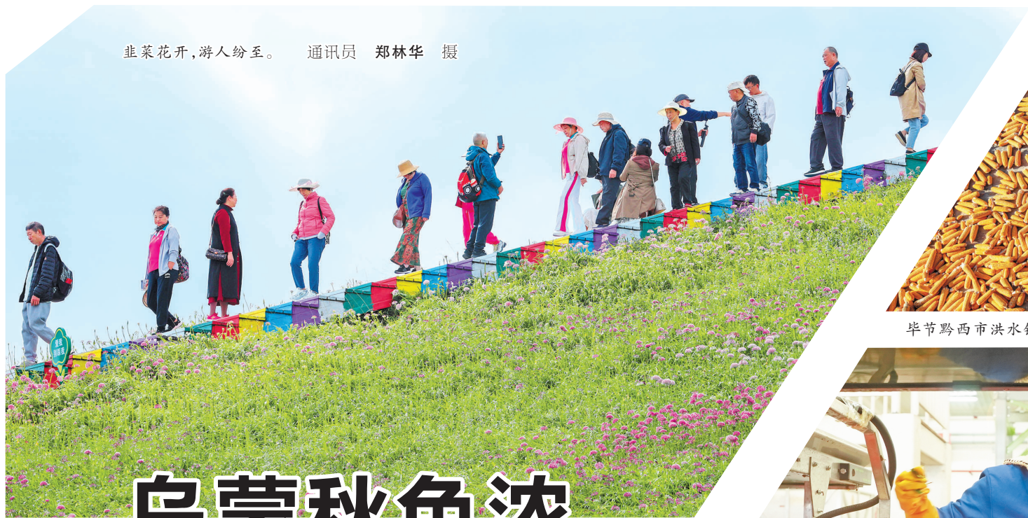
韭菜花开，游人纷至。