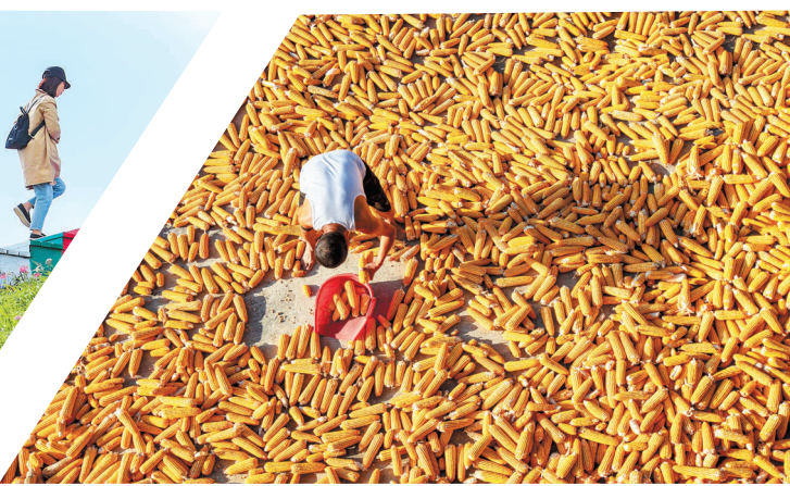
毕节黔西市洪水镇农民晾晒收获的玉米。