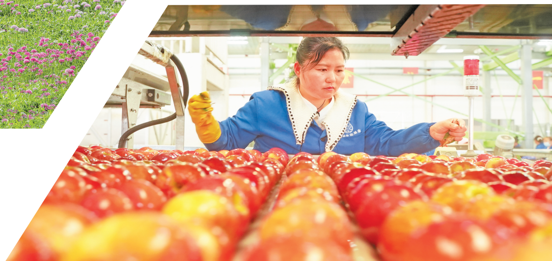
毕节威宁产投生态农业有限责任公司苹果分选。