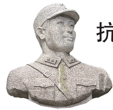
戴安澜将军的半身戎装塑像。

“现在孤军奋斗，决以全部牺牲，以报国家养育！为国战死，事极光荣。”“你们母子今后生活，当更痛苦。但东、澄、澄、四儿，俱极聪俊，将来必有大成……”这些话出自一封没有寄出的家书，是中国远征军殉国的最高级别将领戴安澜1942年在缅甸写给妻子的。