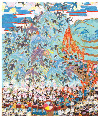
《春漫苗山》作者：侯筱竹。