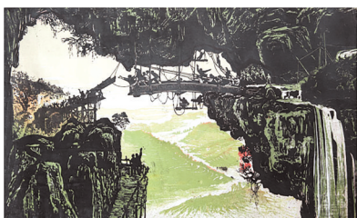
《锅圈图》作者：刘宗河，永印木刻。