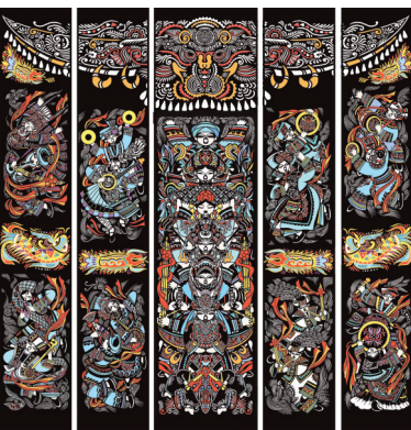
《歌舞颂华章》(特邀)作者：岳红霞、刘华、周泰。