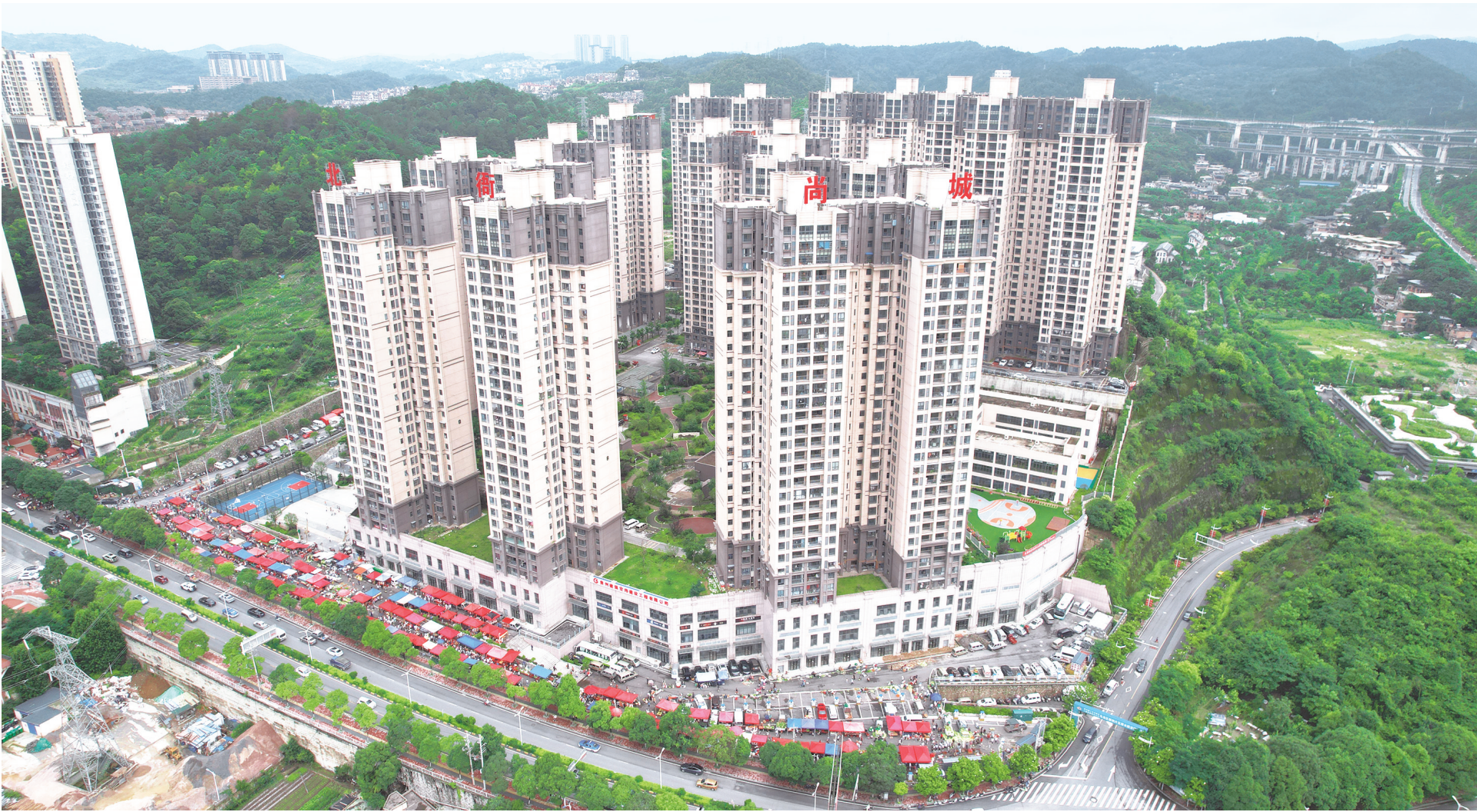
打造高品质居住环境,实现“住有宜居”的愿景。