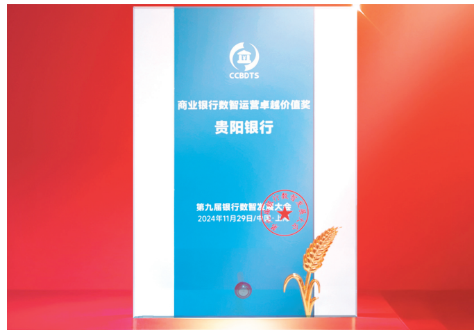
贵阳银行获2024年商业银行数智运营卓越价值奖。

在数字化风控方面，整合行内外海量数据，运用机器学习模型和高级数据分析技术，构建覆盖信用风险、操作风险等的全息风险视图，实现风险的早识别、早预警、早处置，显著提升了风险管理的精准性与时效性，筑牢业务发展的安全防线。