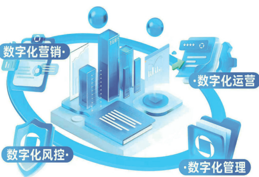
贵阳银行的数字化转型，围绕“客户、风控、运营、管理”四大核心维度全面展开。