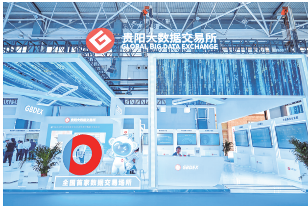
贵阳大数据交易所展台。

当今时代，数字浪潮席卷全球，数字经济成为重塑竞争格局、引领高质量发展的核心引擎。在国家“数字中国”战略和贵州省“数字经济引领支撑行动”的双重驱动下，贵州大数据集团勇闯数字经济蓝海，勇担在实施数字经济战略上抢新机的排头兵使命，从构建政务云平台到运营全国首个数据交易所，从推动AI大模型落地到布局跨区域算力网络，书写了数字经济与实体经济深度融合的贵州篇章，正在新时代的数字赛道上全速奋进。