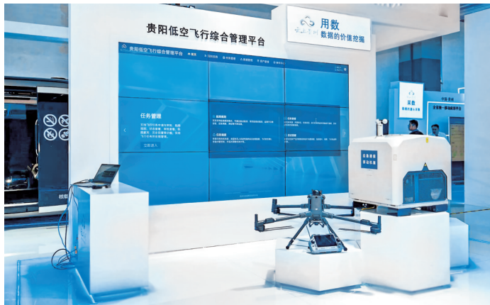
在数博会上展示“智联低空，安全致远”的理念。

贵阳大数据交易所展区则采用“场景化分区+沉浸式体验”的立体化展陈模式，围绕数据交易全生命周期构建“视野、筑基、熔铸、深耕、共融”五大主题展区，系统呈现自身发展历程、市场总览，以及基础服务能力、体系服务能力、专业服务能力、生态综合服务能力五大核心优势。同时，组织“数据要素×行业成果展”，携手多家数据商生态伙伴展示双方在数据要素各场景细分领域的合作成果，全面呈现数据要素驱动行业创新的实践成效。