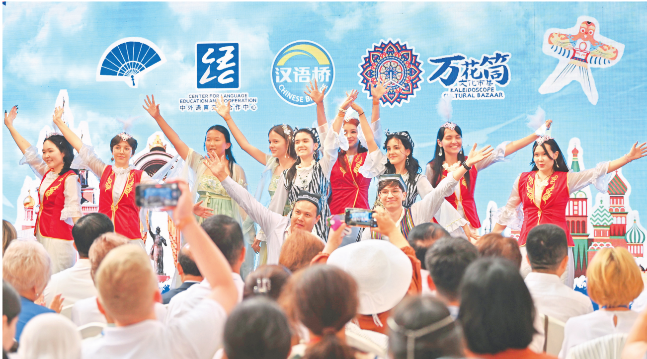
2025年8月6日，“上合之约·丝路津彩”上合国家青年学生“万花筒”文化市集在天津庆王府举行。这是上合国家青年学生在共同表演舞蹈节目。