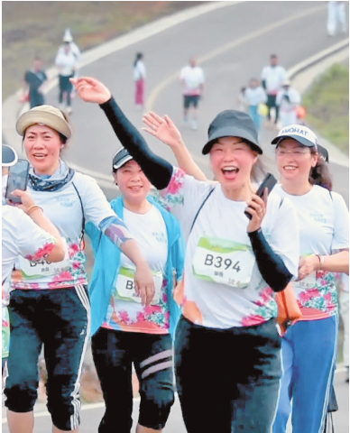
乌蒙大草原健康跑活动。