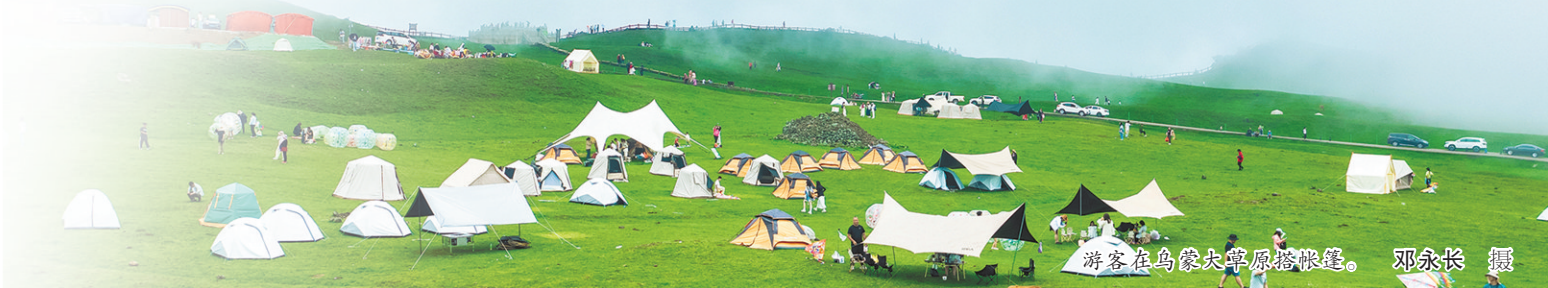
游客在乌蒙大草原搭帐篷。

当清凉经济遇见消费升级,一座城市的活力与温度,正通过游客的购物车传递到更远的地方。