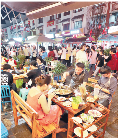
游客品尝烙锅。

二十载光阴流转,六盘水完成了从“江南煤都”向“生态绿都”“避暑胜地”的华丽转身,“19度的夏天”成为镌刻在城市基因里的独特印记。又逢避暑季,六盘水再以清凉为主线,推出一系列文旅融合活动,为游客精心打造一场避暑康养与民族文化交织的夏日盛宴。