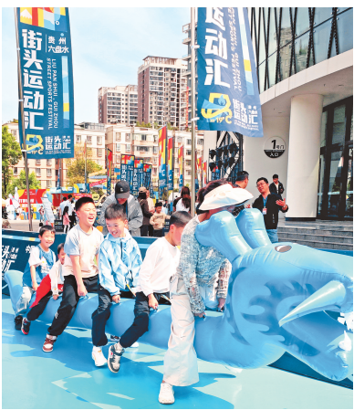
六盘水街头运动汇。