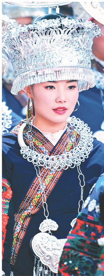
身着苗族盛装参加雷山苗年大巡游的女孩。